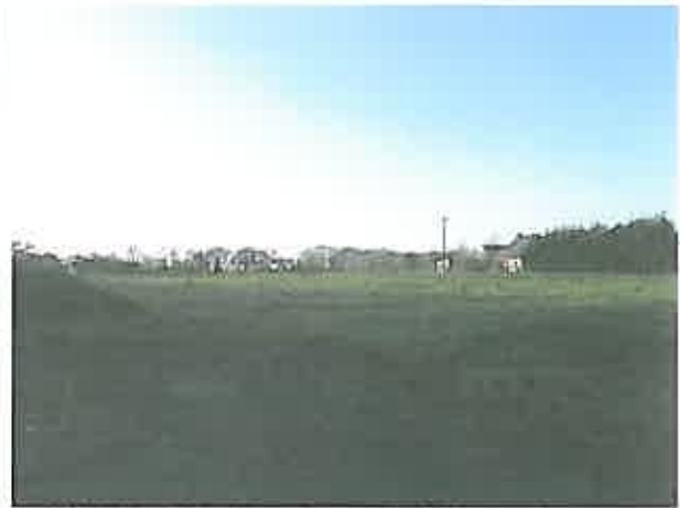
Cliché 2 : Vue Nord Est – Sud Ouest du terrain