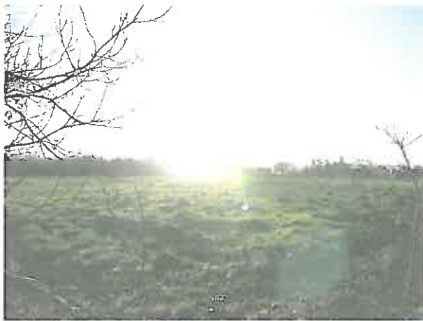
Cliché 1 : Vue Nord Ouest – Sud Est du terrain