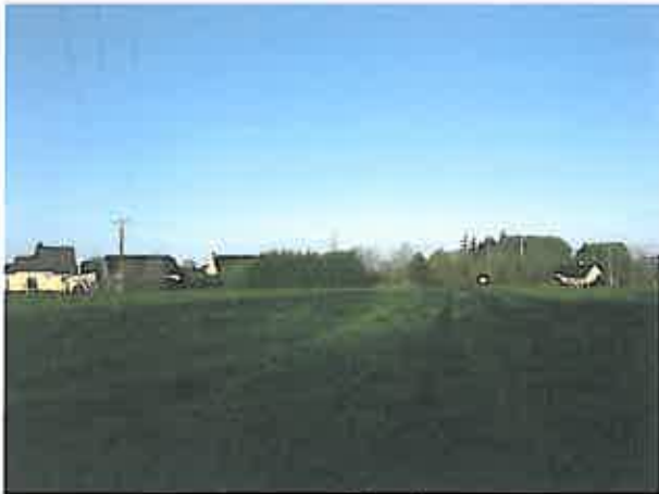
Cliché 3 : Vue Sud Est – Nord Ouest du terrain