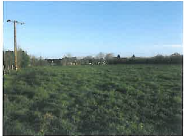
Cliché 4 : Vue Sud Ouest – Nord Est du terrain